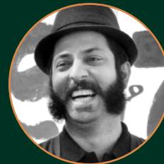
Reza Bakhtiarifard @rbakhtiarifard